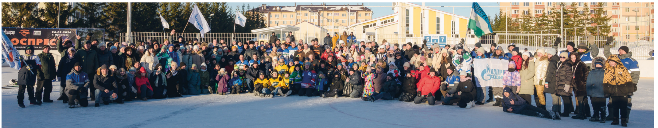
Участники спортивного праздника