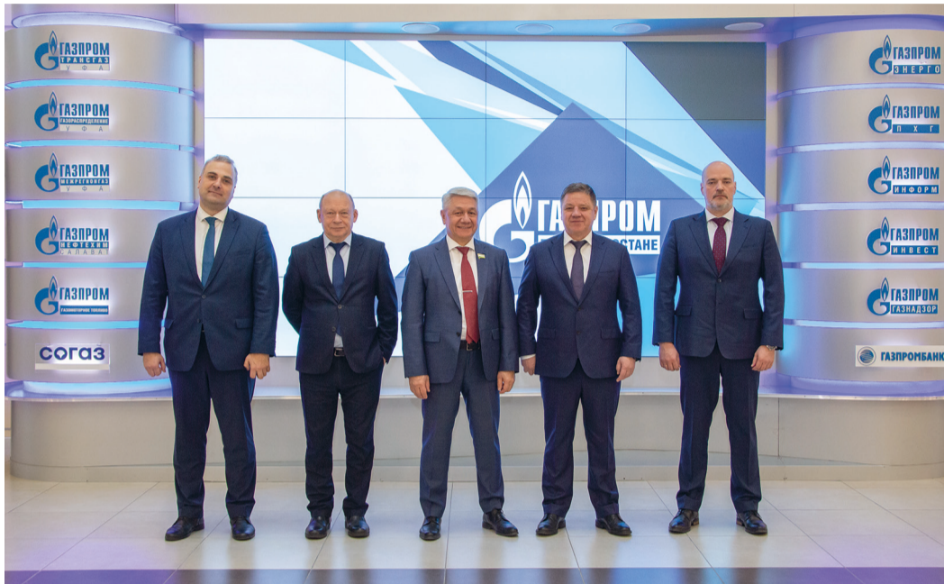
Участники рабочей группы по разработке госпрограммы «Расширение использования природного газа в качестве моторного топлива в Республике Башкортостан на 2024–2030 годы»

По материалам ПОЭКС.