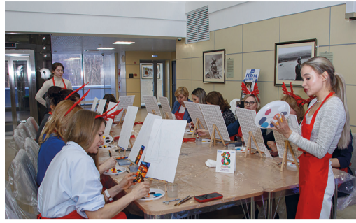
Мастер-класс по рисованию

сотрудницы предприятия после мероприятия.