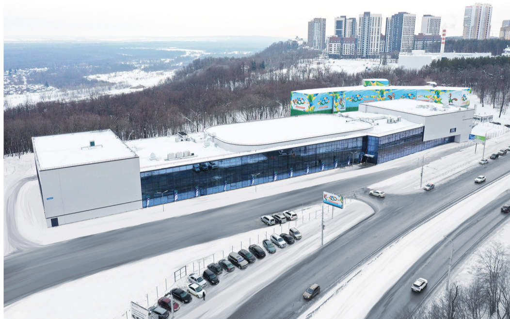
Физкультурно-оздоровительный комплекс с бассейнами, катком и универсальным залом

В рамках социального проекта «Газпром – детям» в Уфе открылся новый Центр спортивной подготовки Республики Башкортостан. Новый спорткомплекс назван в честь общественно-политического деятеля, мэра Уфы Ульфата Мустафина.