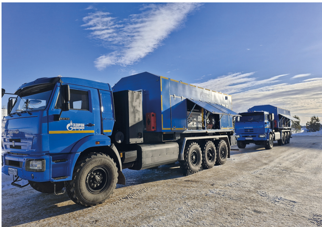
Новая техника на службе УАВР

По информации транспортного отдела.