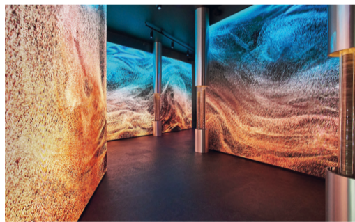
Площадь павильона «Газпром» на выставке «Россия» составляет 1875 квадратных метров, посетителям представлены семь зон активностей

Неподдельный интерес посетителей вызывают лекции от экспертов лучших музеев мира – Эрмитажа, Русского музея, Петергофа, Царского Села, музеев Московского Кремля и других. Мероприятия организованы в рамках проекта ПАО «Газпром» «Друзья Петербурга».