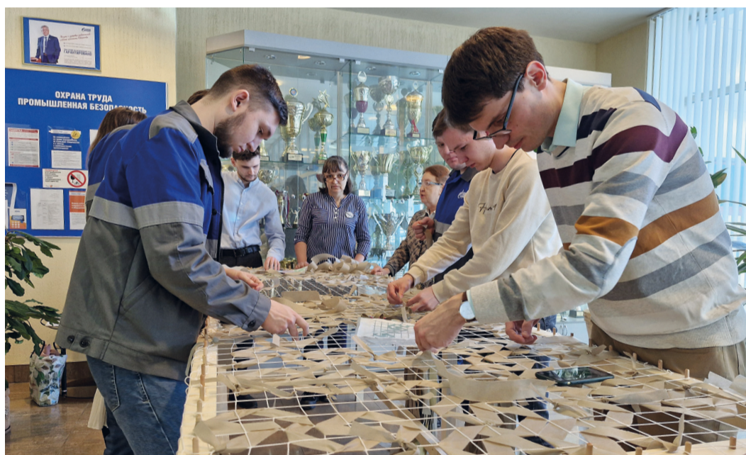
Сотрудники предприятия в свободное от работы время могут присоединиться к патриотической акции

Башкортостан регулярно отправляет в зону специальной военной операции гуманитарные конвои. Адресная помощь для военнослужащих поступает от организаций, общественных объединений, а также неравнодушных граждан республики. Существенный вклад в общее дело вносит ООО «Газпром трансгаз Уфа».