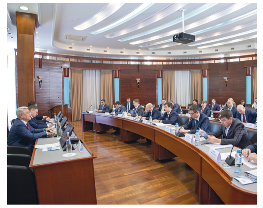
В ходе совещания были рассмотрены предложения по увеличению количества газомоторного транспорта

– Экономия только от одного газомоторного автобуса в год составляет почти 1 млн рублей, а по всему автопарку предприятия