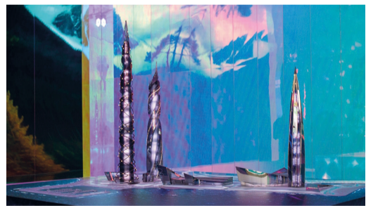
Выставка передает масштабы работы «Газпрома»

Группа Газпром представлена на выставке как единая композиция всех видов бизнеса, демонстрирующая многообразие сфер деятельности и огромный масштаб работы компании. Каждый посетитель павильона сможет совершить необычное путешествие. Мощный аудио- и визуальный контент, использование современных мультимедийных технологий, выстроенная драматургия не оставят никого равнодушным.