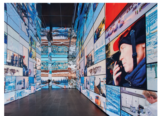
Зал «Люди «Газпрома»» показывает труд почти полумиллиона сотрудников сотен профессий и специальностей

Диалоги о культуре касаются масштабных проектов, проводимых музеями при поддержке «Газпрома». Так, посетители лектория познакомились с богатейшими коллекциями произведений искусства нашей страны, узнали о творческих методах знаменитых российских художников, погрузились в историю создания