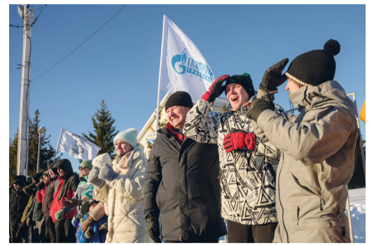
Болельщики поддерживают команды

– Как человек, который родился и жил в Уфе, искренне рад тому, что в городе открылся такой замечательный комплекс. Для столицы Башкортостана это прекрасный подарок от компании «Газпром»