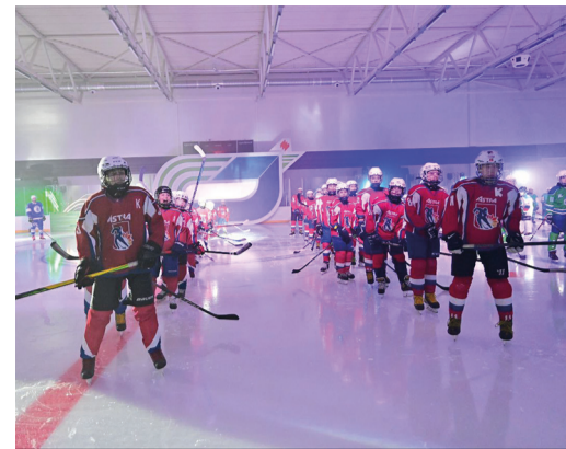
Юные хоккеисты оценили лед

«Газпром – детям» – самый крупный социальный проект Группы Газпром, аналогов которому по масштабу и охвату в России нет. Он направлен на популяризацию спорта и здорового образа жизни среди подростков. За время существования проекта с 2007 по 2023 годы построено и реконструировано 2132 спортивных и социальных объекта. В разных уголках Башкортостана при участии предприятий Группы Газпром создана разветвленная сеть спортивных объектов в шаговой доступности для тысяч людей. В городе Уфе