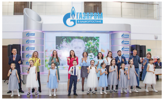
Воспитанники детского ансамбля «Гармония» вместе с родителями

В этом году весенний праздник прошел в новом формате – атриум производственного корпуса в центральном офисе предприятия превратился в «Территорию женского счастья».