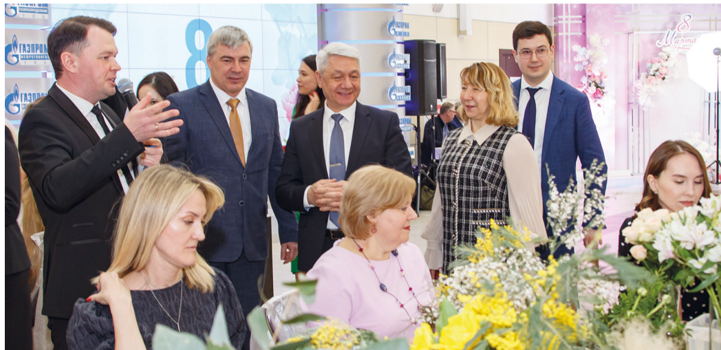
Праздник для прекрасных дам

– Очень понравился новый формат праздника – в каждой зоне участницы могли найти что-то интересное и увлекательное. Спасибо организаторам, – поделились