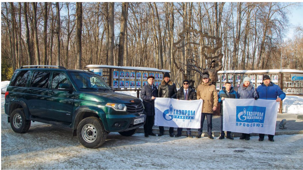
Отправка гуманитарного груза в зону СВО

в составе гуманитарного груза – налобные фонарики, батарейки к ним, продовольствие и необходимые медикаменты (антибиотики, жаропонижающие, кровоостанавливающие препараты, шприцы, индивидуальные перевязочные пакеты и др.).