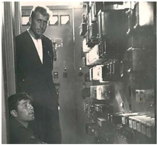
В Красногорском ЛПУ, 1965 г.

– Когда заканчиваешь большую работу, всегда испытываешь невероятную грусть. Словно расстаешься с кем-то из близких тебе лю-