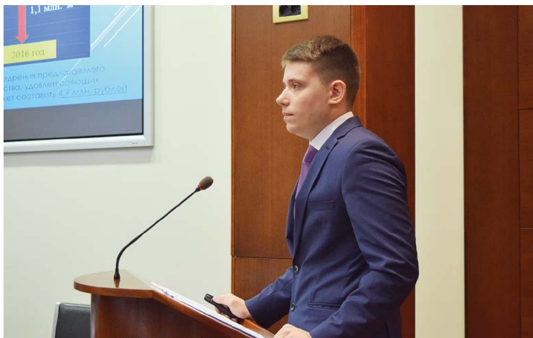
Волнительный момент защиты проекта