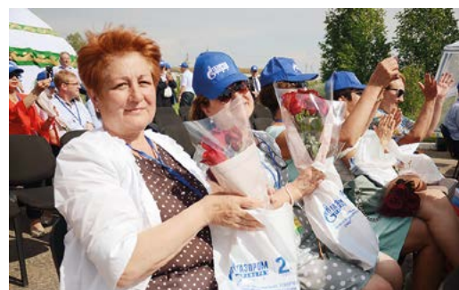
В ОТВЕТЕ ЗА СНАБЖЕНИЕ стр. 4