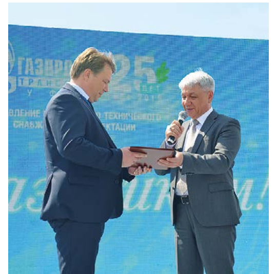
Искренние поздравления – коллективу филиала