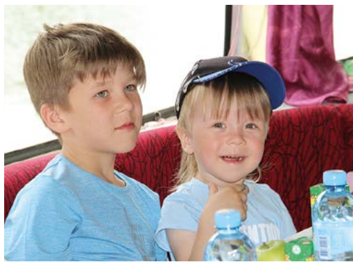
Летние каникулы открылись прогулками на теплоходе

– Для наших воспитанников такие праздники имеют большую ценность, – отметила