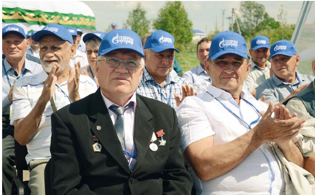
На праздник были приглашены те, кто в разные годы трудился в филиале

Вот уже четверть века Управление материально-технического снабжения и комплектации обеспечивает «Газпром трансгаз Уфа» необходимыми материалами и оборудованием по всем направлениям деятельности компании, будь то капитальный ремонт, строительство, реконструкция, техническое перевооружение объектов или эксплуатационные нужды.