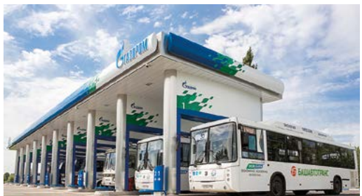
АНГКС-2 г. Уфы

В 2019 году для работы на маршрутах Уфы будет закуплено 74 автобуса большой вместимости «НефАЗ» с двигателем на природном