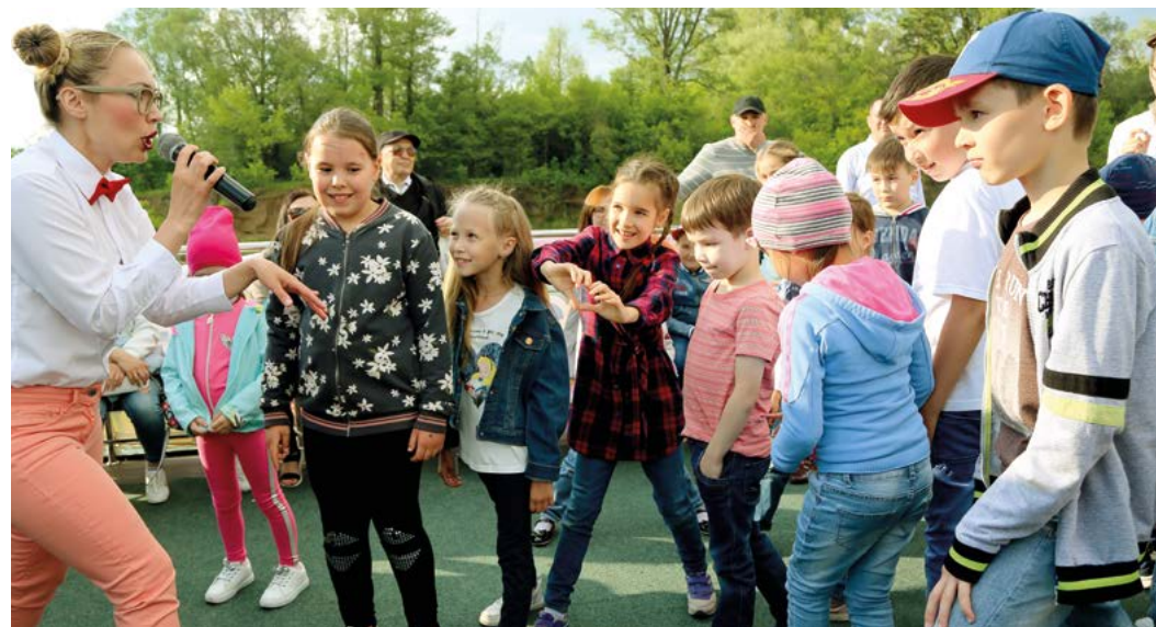
В мероприятии приняли участие дети из разных районов республики