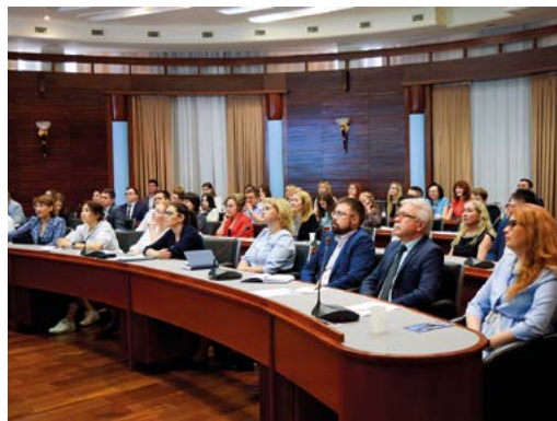
Форум ежегодно собирает представителей со всех подразделений Общества

Заместитель генерального директора по управлению персоналом ООО «Газпром