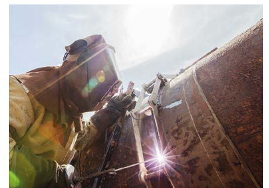
Все дефекты устранены

Сегодня все опасные дефекты на четырех газопроводах устранены. В порядок, в том числе, приведен и самый отдаленный от Управления участок трассы – у границы с Пермским краем. Впереди – работы на газопроводе Челябинск–Петровск.