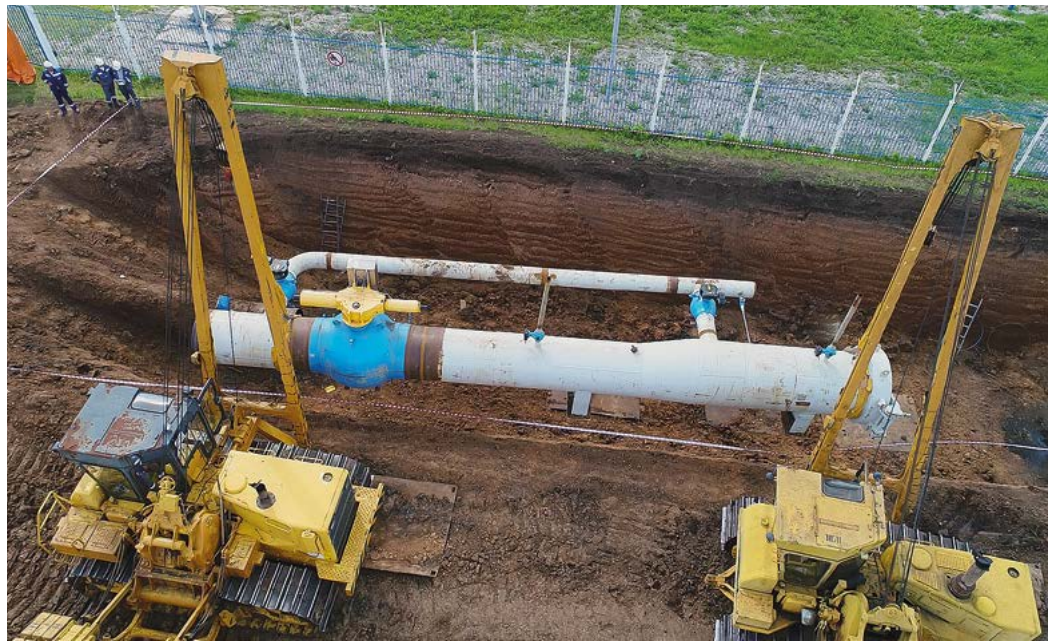
Внутритрубная диагностика проведена на восьмикилометровой участке газопровода Уренгой–Новопсков впервые

В Бирском районе республики в течение двух недель обследовали участок подводного перехода магистрального газопровода Уренгой–Новопсков. В огневых работах приняли участие около 100 человек. Тем временем в Полянском ЛПУМГ продолжились мероприятия по устранению дефектов на газопроводе Ямбург–Поволжье.