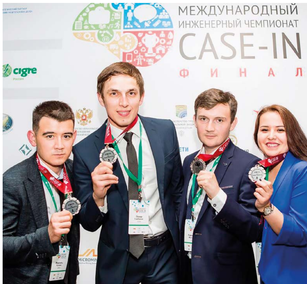
Команда «Газпром трансгаз Уфа» – серебряный призер Международного инженерного чемпионата