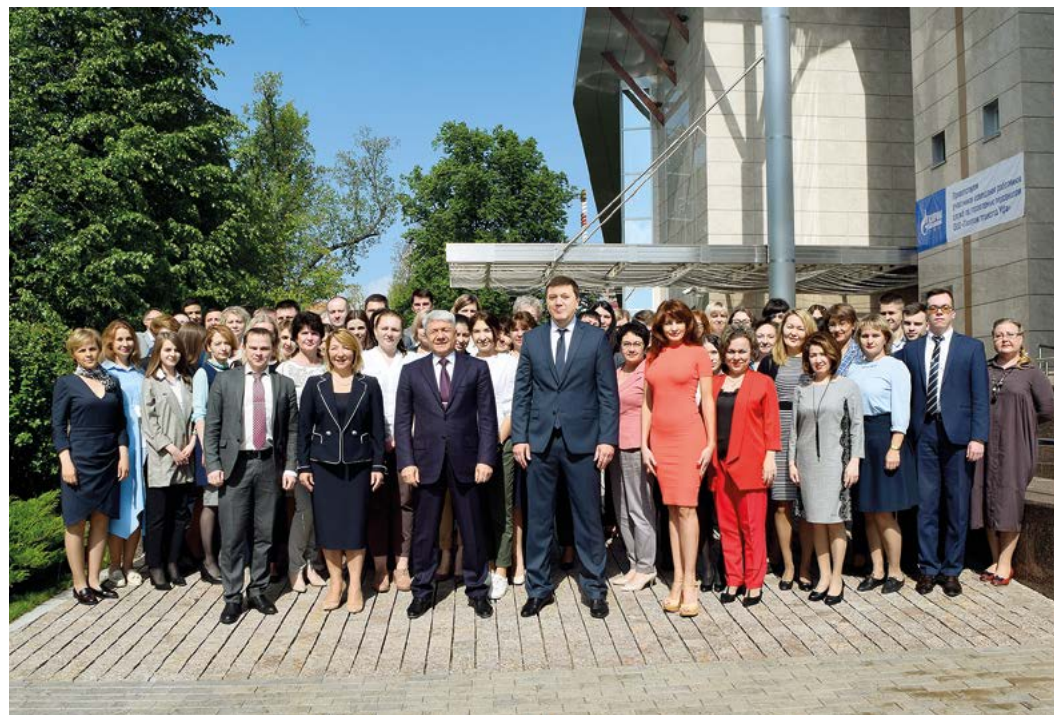
Работники кадровых служб «Газпром трансгаз Уфа» – надежная команда!