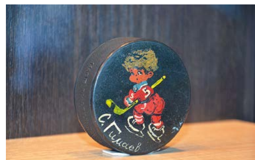
ПОМНИМ, НАИЛИЧ! стр. 7