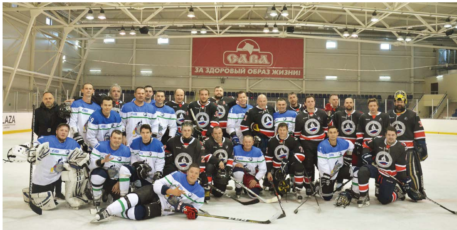
Башкирские газотранспортники одержали громкую победу в игре с федеральными журналистами