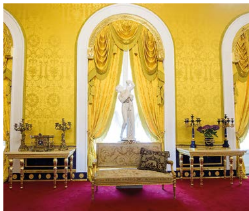
Интерьер Лионского зала Екатерининского дворца

В Государственном музее-заповеднике «Царское село» (г. Пушкин) состоялось открытие после реставрации Лионского зала Екатерининского дворца. Проект реализован при поддержке ПАО «Газпром» и Фонда ENGIE (Франция). В ходе реставрационных работ