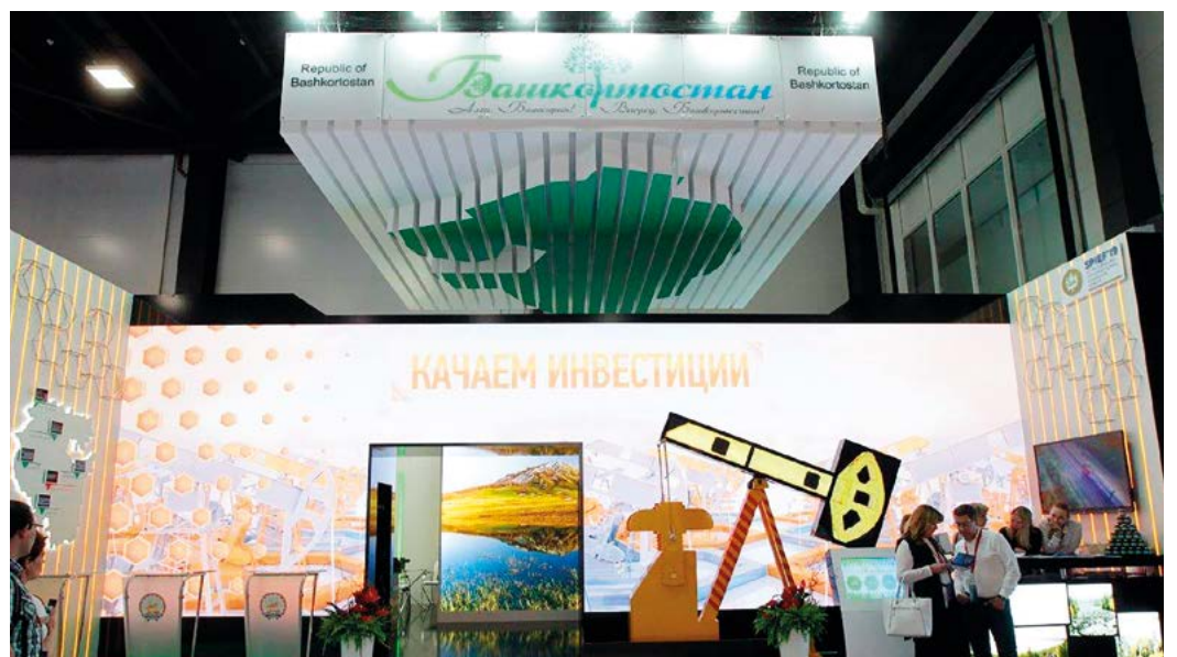
Для Башкортостана форум стал рекордным по объему инвестиций