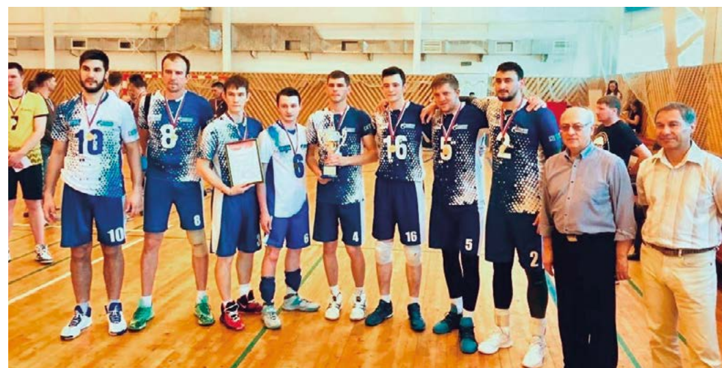
«Витязь-ГТУ» снова побеждает!

В Уфе на базе Республиканской школы-интерната № 5 спортивного профиля состоялись традиционные соревнования по волейболу среди мужских команд региональных предприятий нефтегазовой отрасли и строительства в рамках первенства Республиканской организации Нефтегазстройпрофсоюза России.