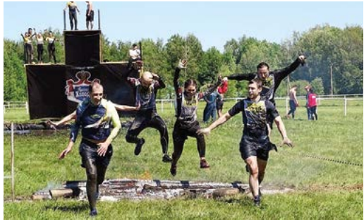
«Урбан» – более компактный формат забега

В д. Николаевка Уфимского района состоялся федеральный забег с препятствиями «Гонка героев». Участие в нем приняла команда предприятий «Газпром межрегионгаз Уфа» – «Газпром газораспределение Уфа».