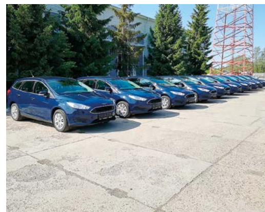
Легковые автомобили получили все филиалы предприятия

В распоряжение филиалов ООО «Газпром трансгаз Уфа» поступило 14 легковых автомобилей, работающих на природном газе. В прошлом году автопарк пополнился 25 единицами автобусов, грузовой и специальной техники с метановыми двигателями. Сегодня боль-