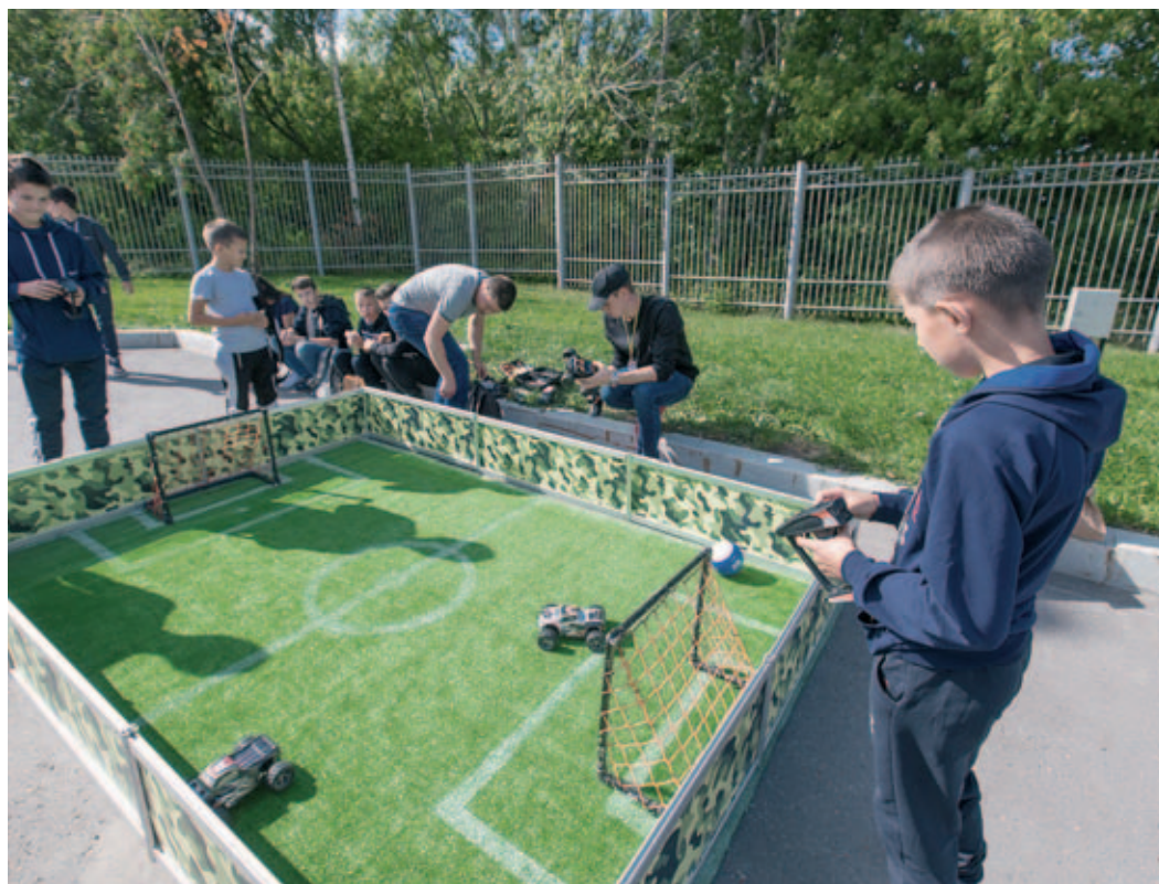
Спортивный праздник запомнится не только взрослым, но и детям

Ольга ЗУБАЧЕВСКАЯ, Максим БАЛОБАНОВ.