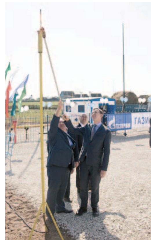
Символический газовый факел дал старт газоснабжению еще четырех деревень в Республике Башкортостан

Ольга ЗУБАЧЕВСКАЯ. По материалам СМИ.