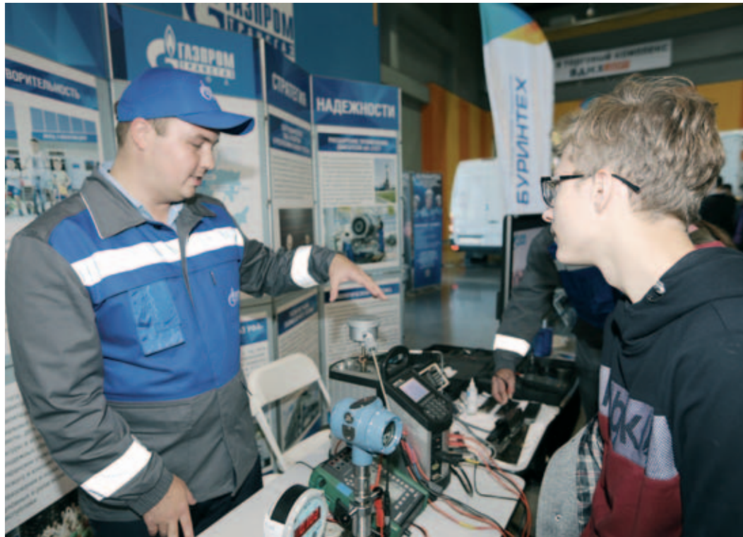
Специалисты ИТЦ знакомят школьников с профессией метролога

В Уфе прошли Дни карьерного построения для молодежи: состоялся I республиканский форум «PROFУСПЕХ», а затем республиканский фестиваль востребованных профессий «PROFФЕСТ». В них приняли участие крупные работодатели республики, такие как «Башнефть», «Транснефть-Урал», «ОДК-УМПО», «БЭСК». Исключением не стало и наше предприятие. За два дня только фестиваль «PROFФЕСТ» посетили более 15 тысяч учеников из 304 школ республики.