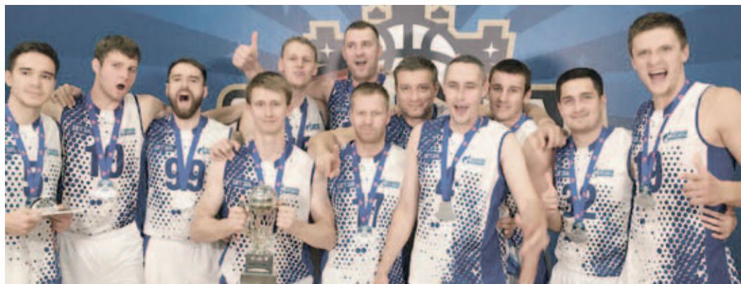
«Витязь-ГТУ» готов сражаться за кубок победителя МЛБЛ в следующем году

В Москве прошел суперфинал Межрегиональной любительской баскетбольной лиги (МЛБЛ). В рамках соревнований сборная ООО «Газпром трансгаз Уфа» «Витязь-ГТУ» провела серию встреч в своей группе и встретилась в финале с московской командой Inamoto.