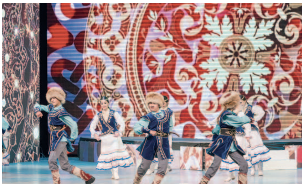
На сцене – образцовый хореографический ансамбль «Далан» Кармаскалинского филиала ООО «Газпром трансгаз Уфа»