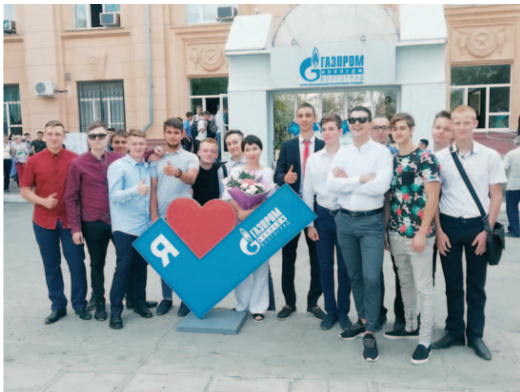
Выпускники ЧПОУ «Газпром колледж Волгоград» уверены в завтрашнем дне!

Начало учебного года для девятиклассников – серьезный повод задуматься о своей будущей профессии и решить: продолжить обучение в школе или поступить в среднее специальное учебное заведение. Хочешь быть уверен в завтрашнем дне и при хороших показателях учебы – в трудоустройстве в организациях Группы «Газпром»? Тогда тебе – в «Газпром колледж Волгоград»!