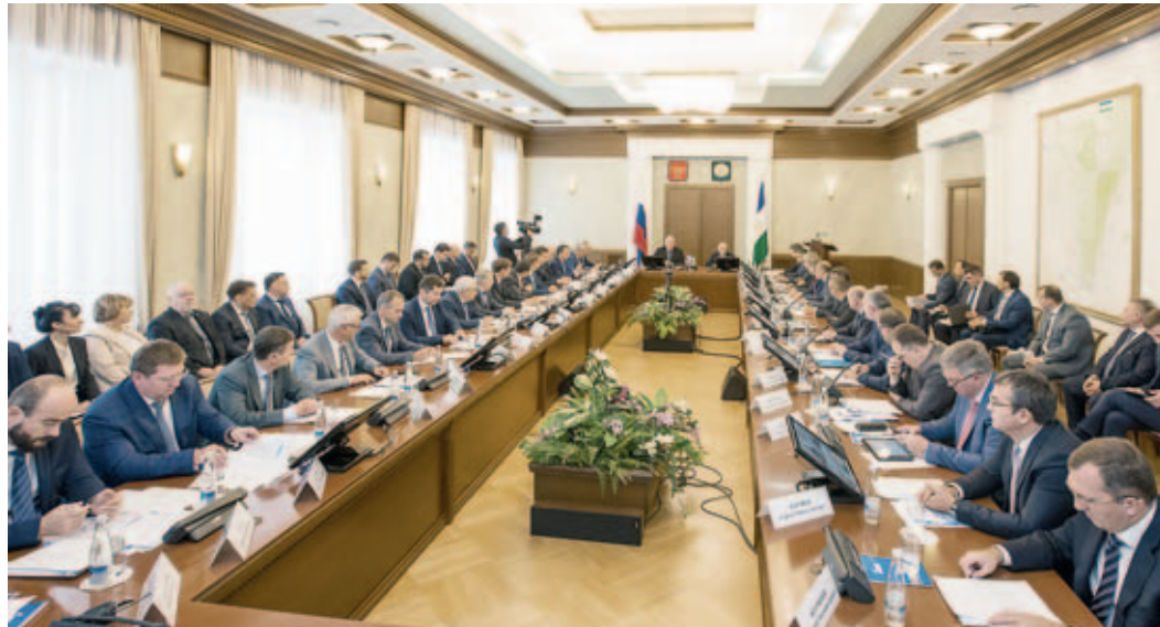
На заседании были озвучены первоочередные задачи, которые «Газпром» и власти Башкирии ставят перед собой в республике