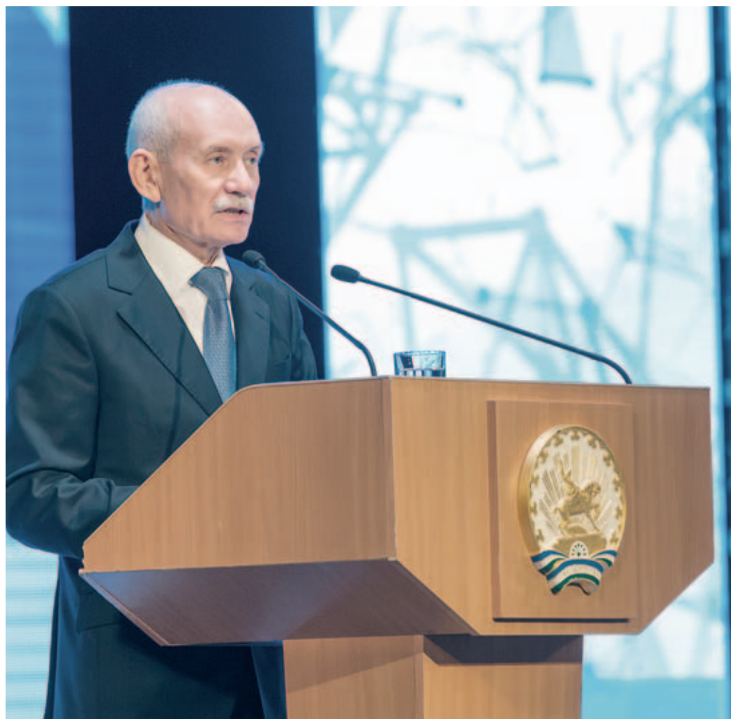
Глава Башкортостана Рустэм Хамитов отметил, что в последние годы взаимодействие республики с Группой «Газпром» стало примером эффективного сотрудничества государства и бизнеса