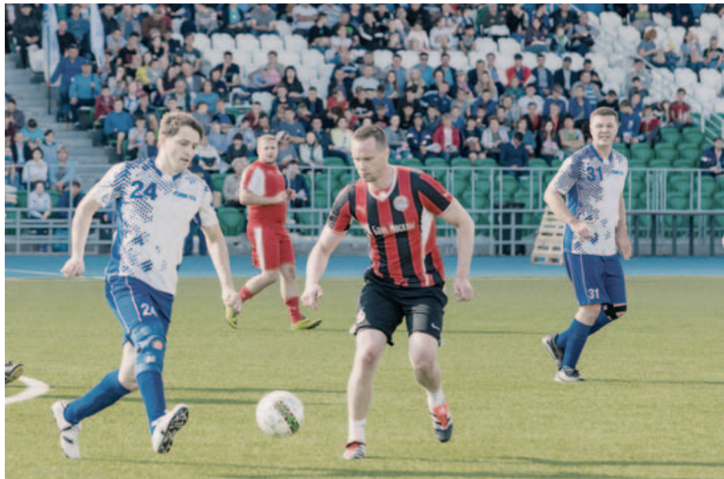
В таком составе руководители ООО «Газпром трансгаз Уфа» впервые вышли командой на футбольное поле