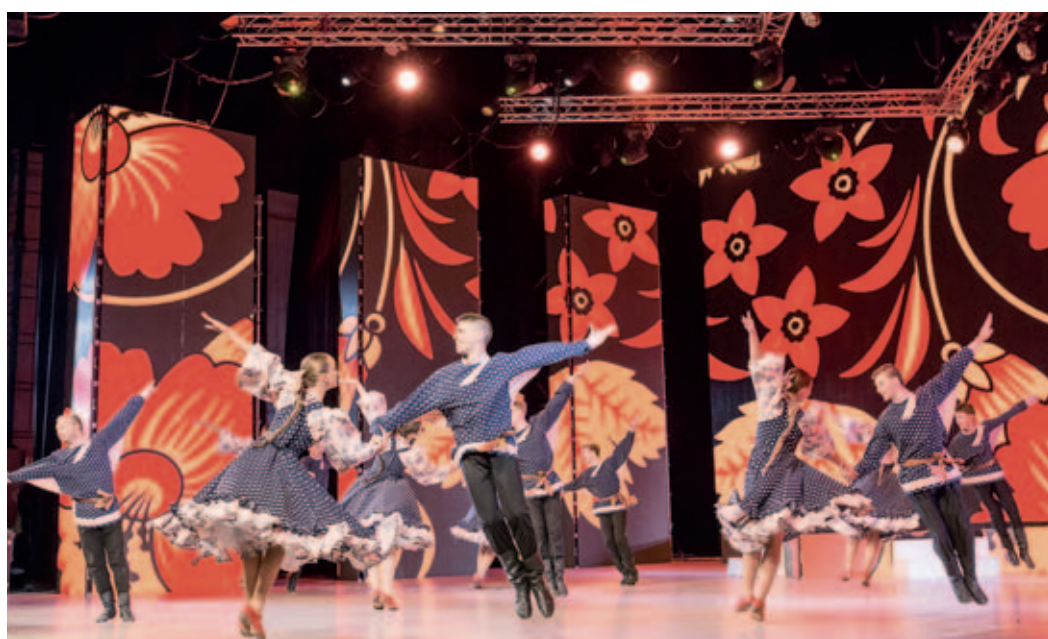
Танцевальный подарок от ООО «Газпром нефтехим Салават»