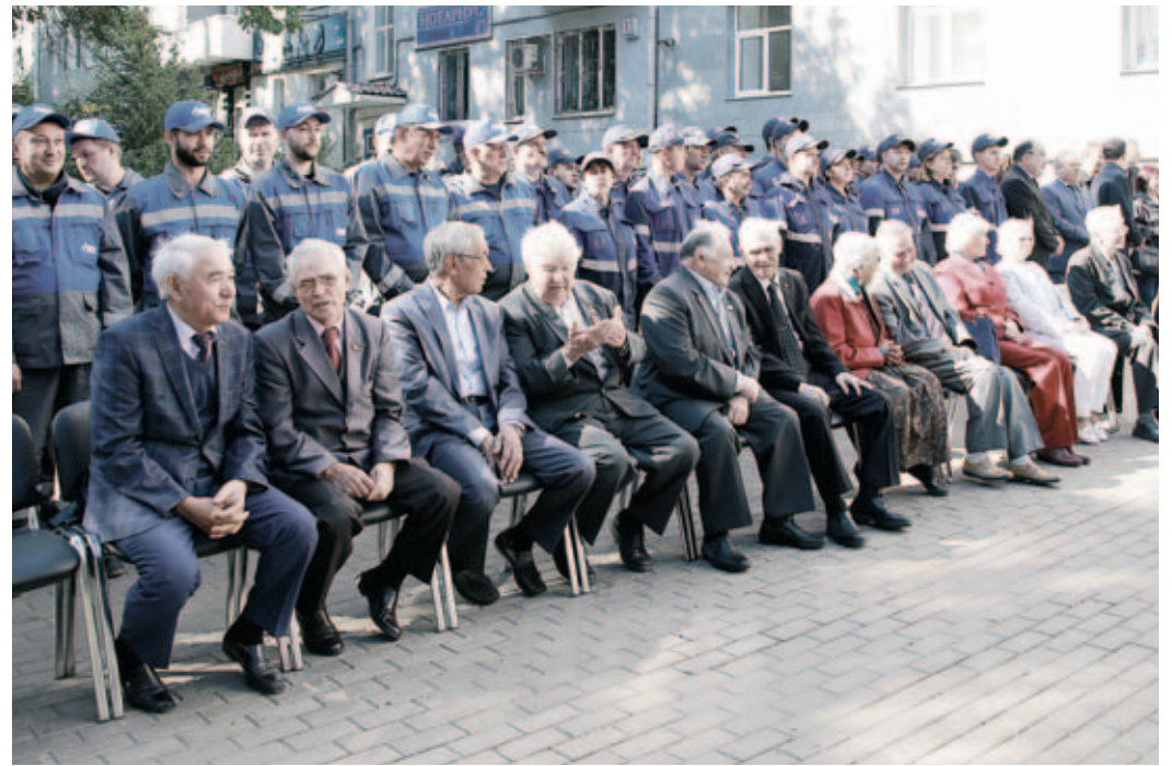
В торжественной церемонии приняли участие ветераны и нынешние работники газовой отрасли

Владимир ЛЕОНТЬЕВ (по материалам RBTODAY.ru).