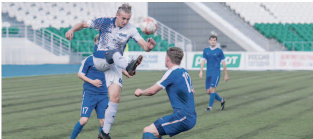
Футболисты «Витязь-ГТУ» стали третьими в зоне «Урал – Западная Сибирь»

За тур до окончания зонального первенства страны ФК «Витязь-ГТУ» досрочно стал третьим в зоне «Урал – Западная Сибирь». Этому поспособствовала очередная крупная домашняя победа. В этот раз был повержен омский «Иртыш». Итог игры – 6:0.