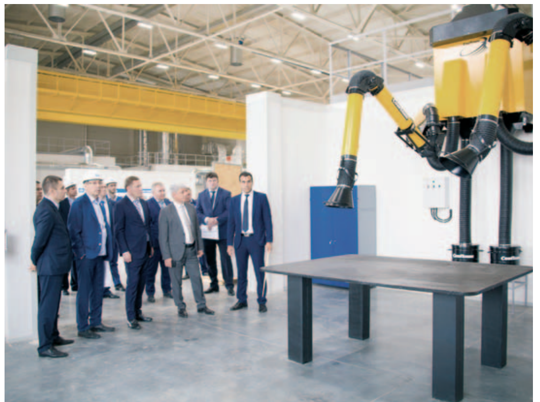
Наличие механосборочного цеха позволит ускорить сроки и качество ремонта газопроводов