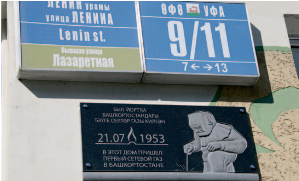
Теперь дом по улице Ленина в Уфе украшает такая памятная табличка

В столице Республики Башкортостан состоялась торжественная церемония открытия мемориальной доски на фасаде дома № 9/11 по улице Ленина – именно сюда 65 лет назад был подан первый сетевой газ в республике.