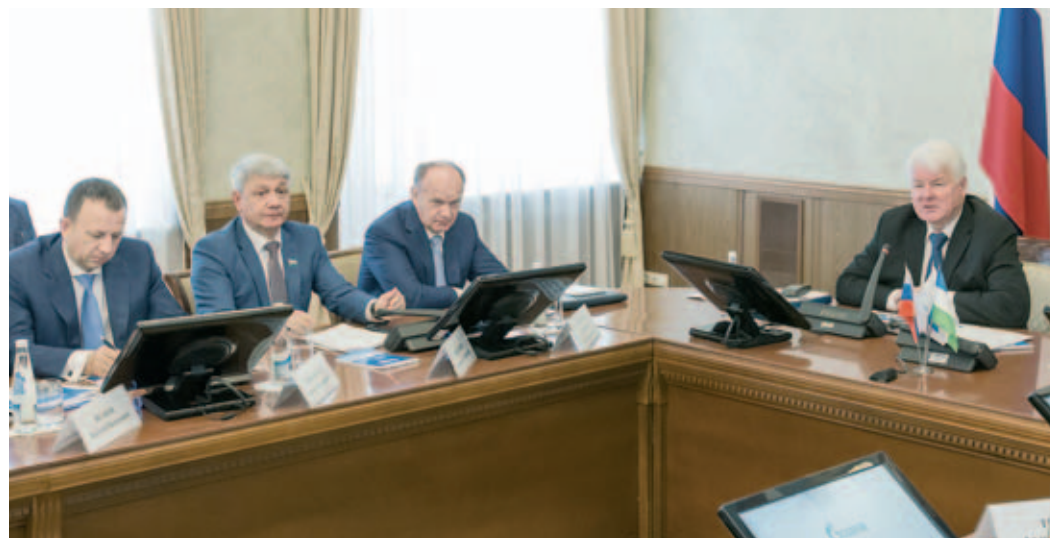
Валерий Голубев: «Несмотря на высокие цифры официальной статистики, мы понимаем, что это, скорее, потенциальная доступность природного газа»