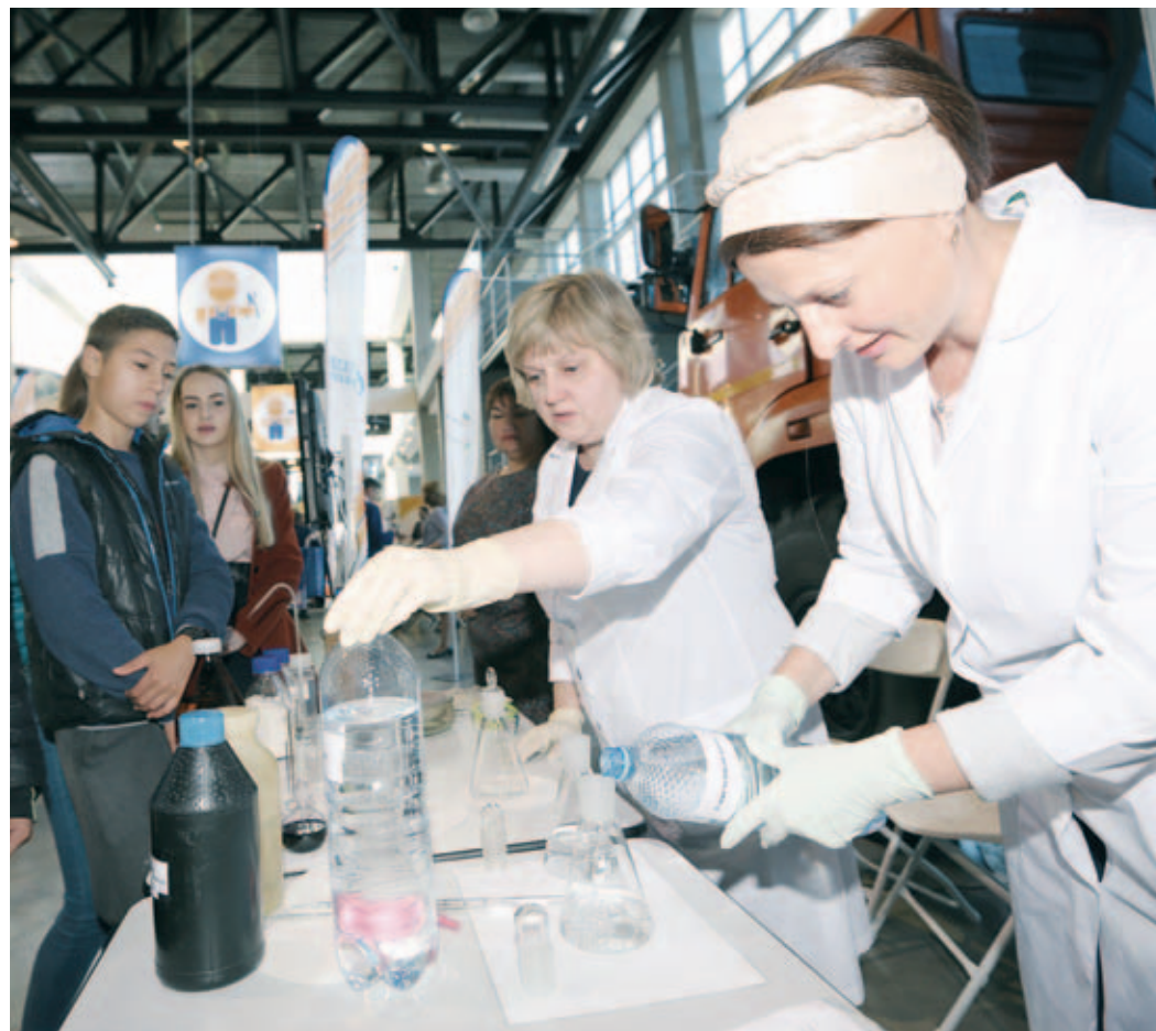
Лаборанты Стерлитамакского филиала Общества показывают опыты по определению кислотности сред