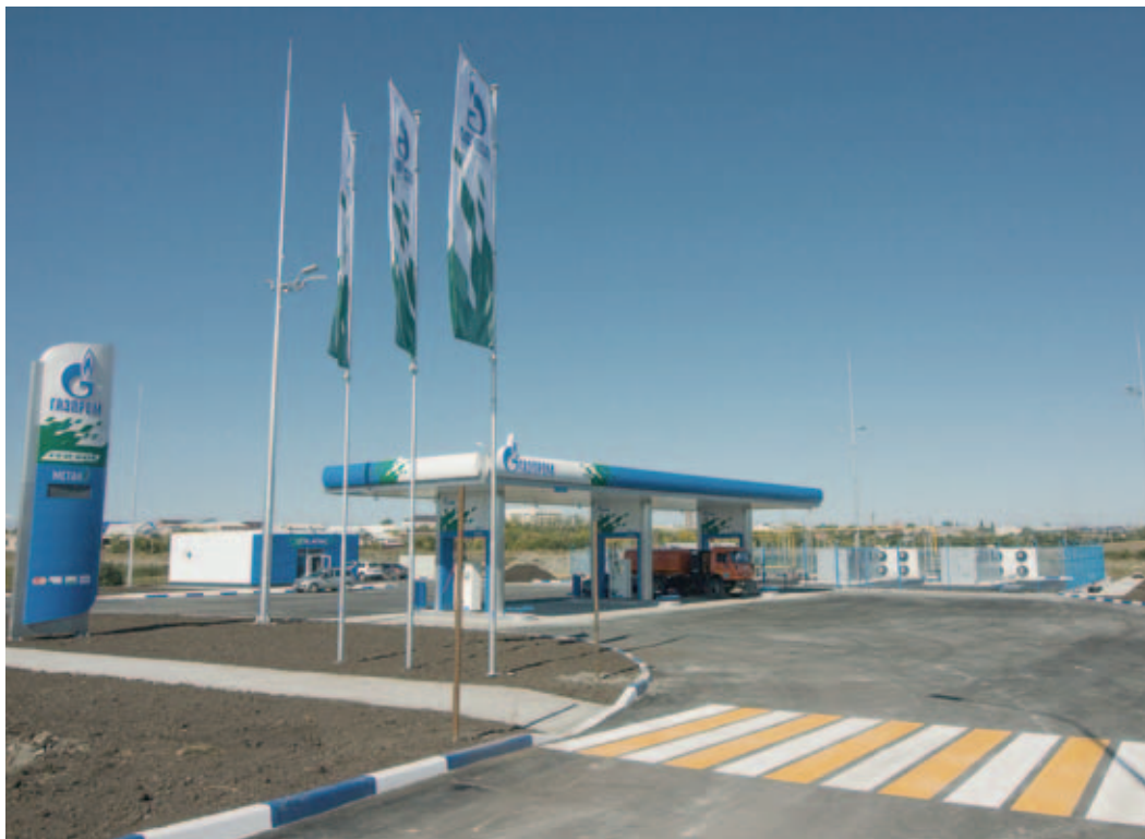
Станция связала газомоторным коридором Республику Башкортостан и соседние области

В г. Сибай состоялся ввод в эксплуатацию автомобильной газонаполнительной компрессорной станции (АГНКС) сети «Газпром», 14-й в регионе и первой в башкирском Зауралье.