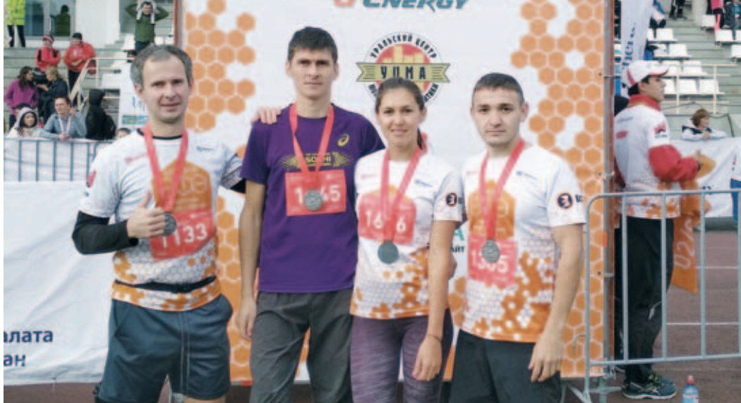
Газотранспортники-участники IV Уфимского международного марафона

В первые дни осени в столице Башкортостана прошел четвертый Уфимский международный марафон. В нем приняли участие порядка 3600 спортсменов из 16 стран и свыше 200 городов мира. Среди бегунов можно было заметить и работников нашего предприятия..