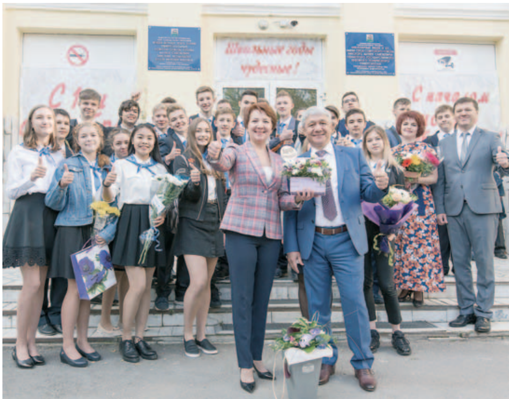
Новый набор «Газпром-класса», в добрый путь!

В инженерном лицее № 83 им. М. Пинского открыл свои двери второй набор «Газпром-класса». Уже по традиции узнать будущих газовиков на торжественной линейке просто. В их форме присутствуют корпоративные сине-белые цвета, а лица озаряет улыбка от радости поступления в «Газпром-класс».