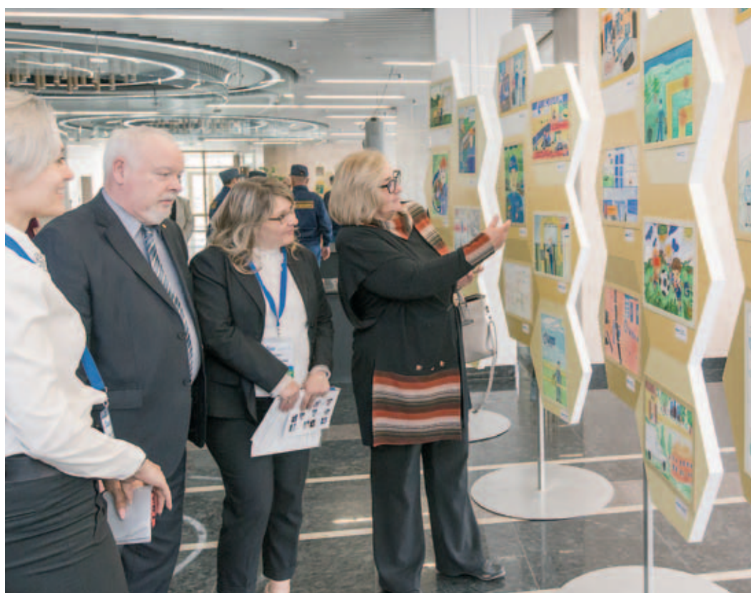
Выставка рисунков «Газпром» глазами детей»