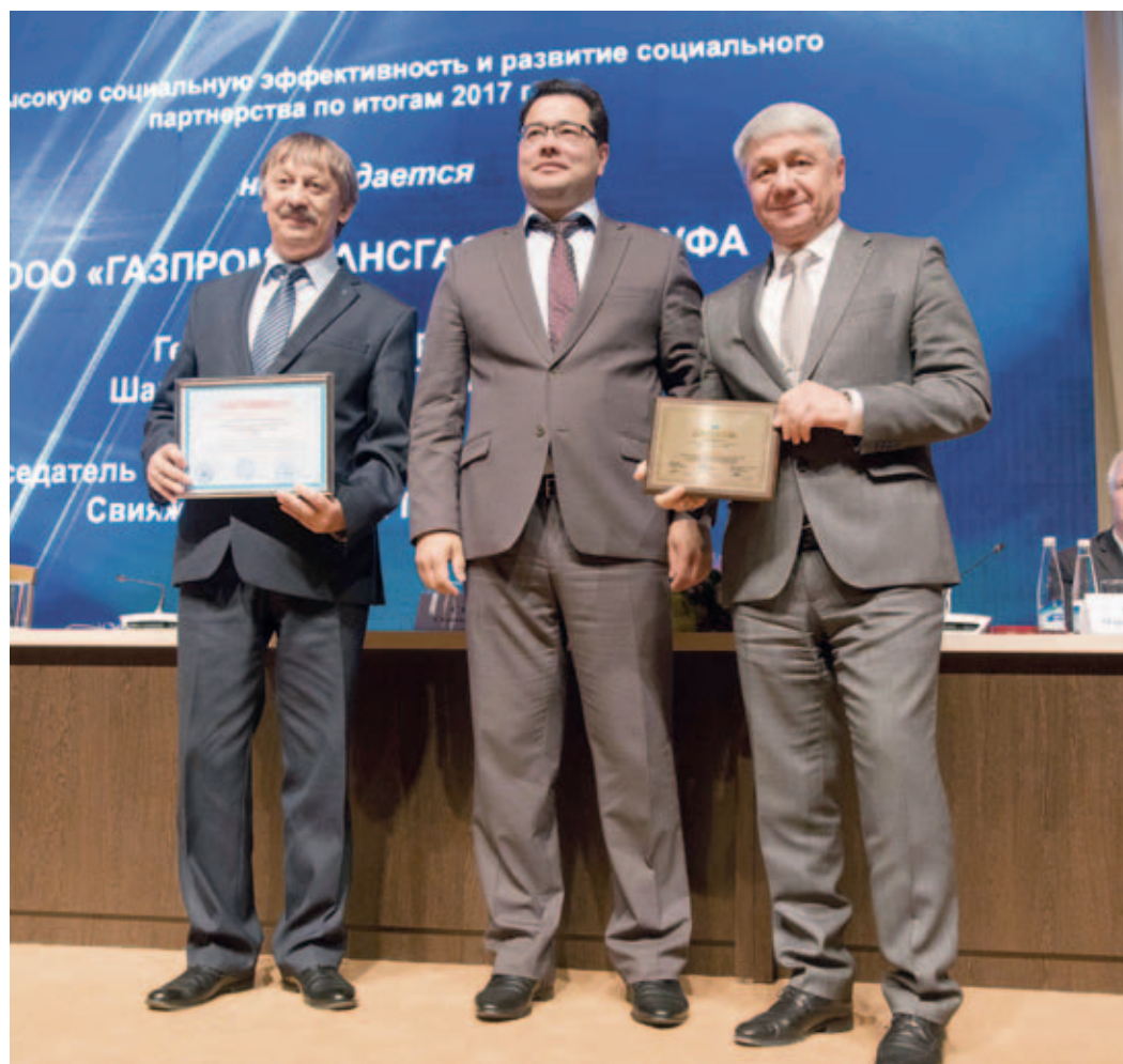
Общество завоевало первое место в республиканском межотраслевом конкурсе «За высокую социальную эффективность и развитие социального партнерства» по итогам 2017 года

Эльвира КАШФИЕВА. По материалам ИА «Башинформ».