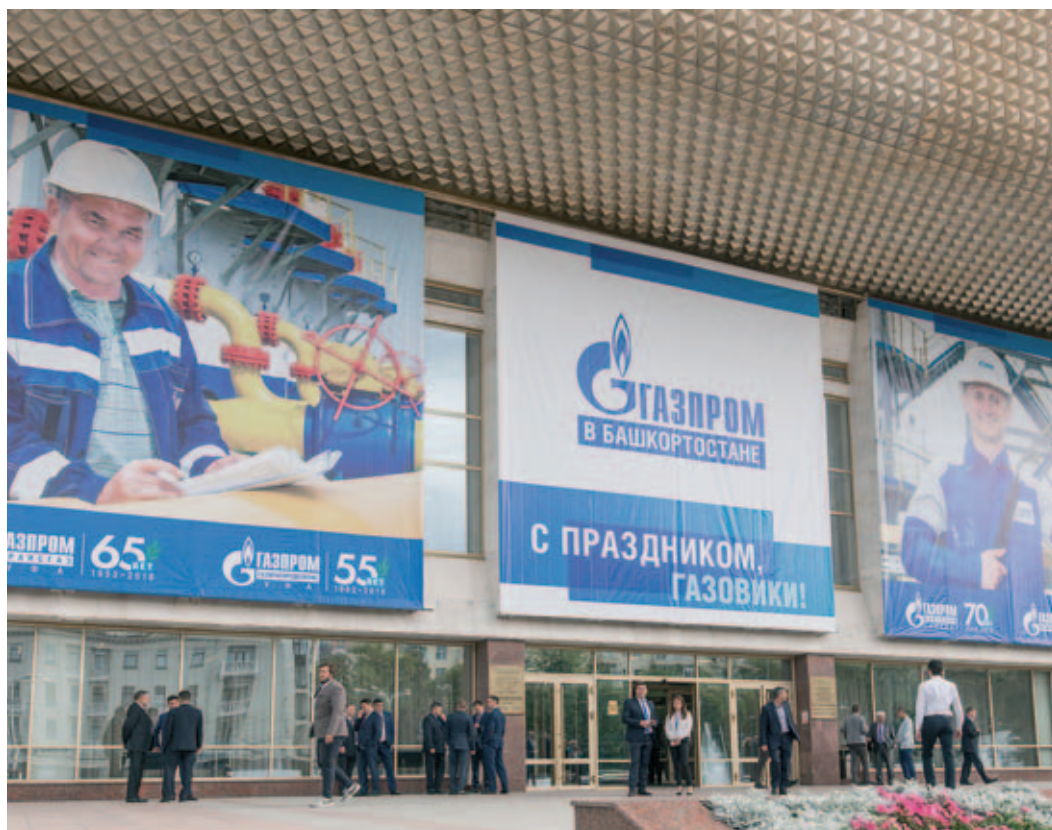
Организовать совместный праздник предприятия ассоциации «Газпром» в Башкортостане» решили впервые