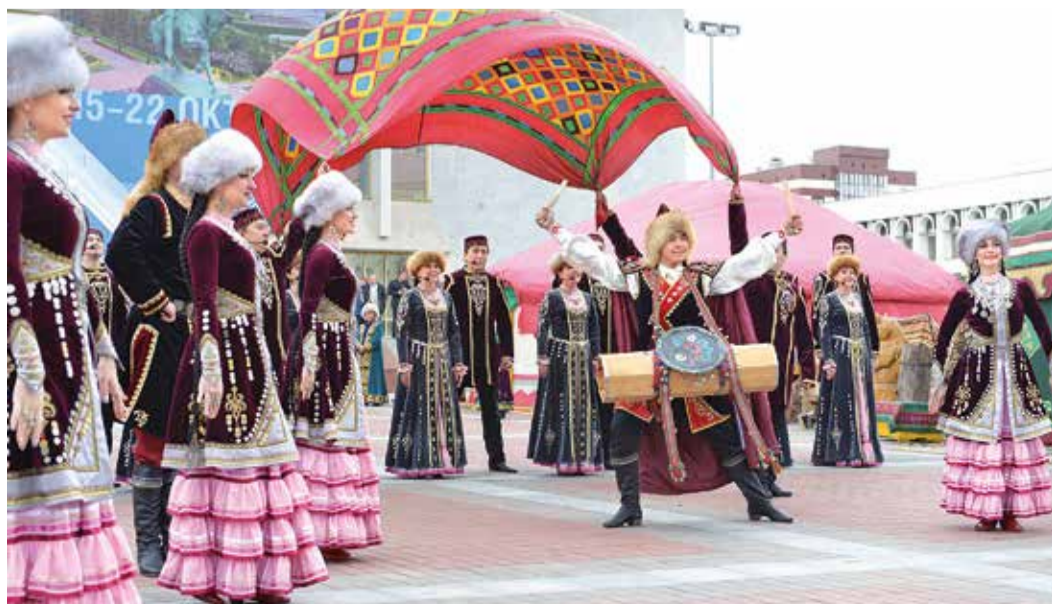
Открытие этнопарка перед ГКЗ «Башкортостан»