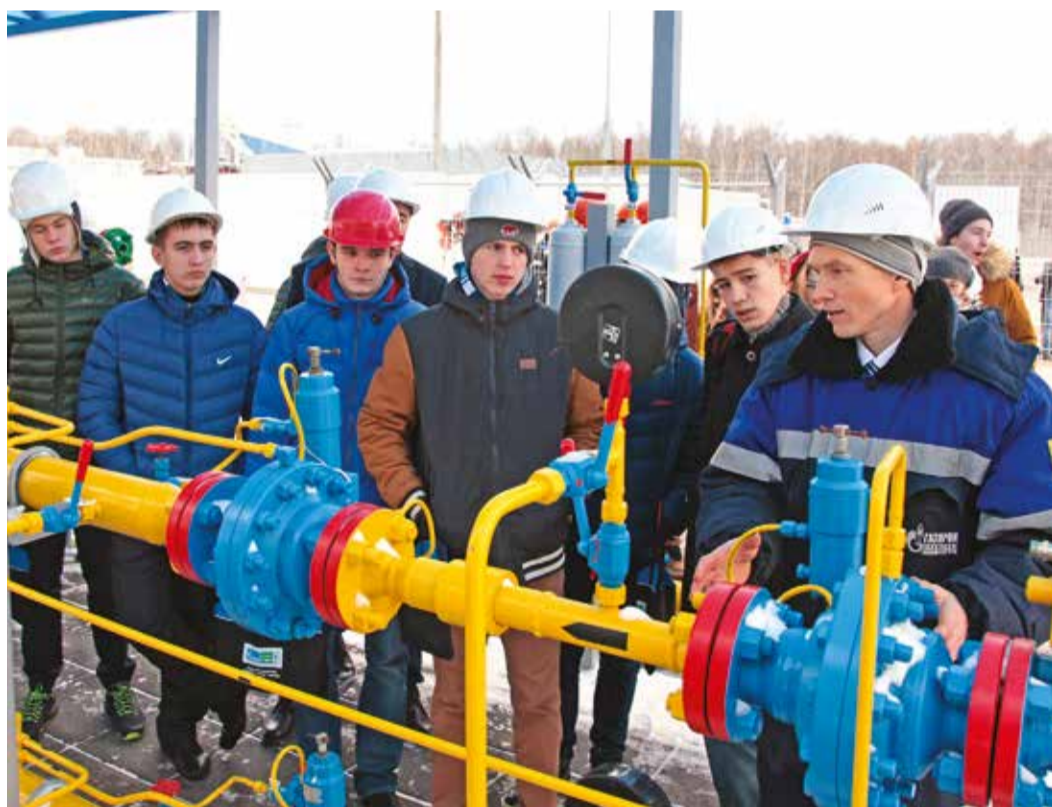
Ученики уфимского «Газпром-класса» во время посещения производственных объектов