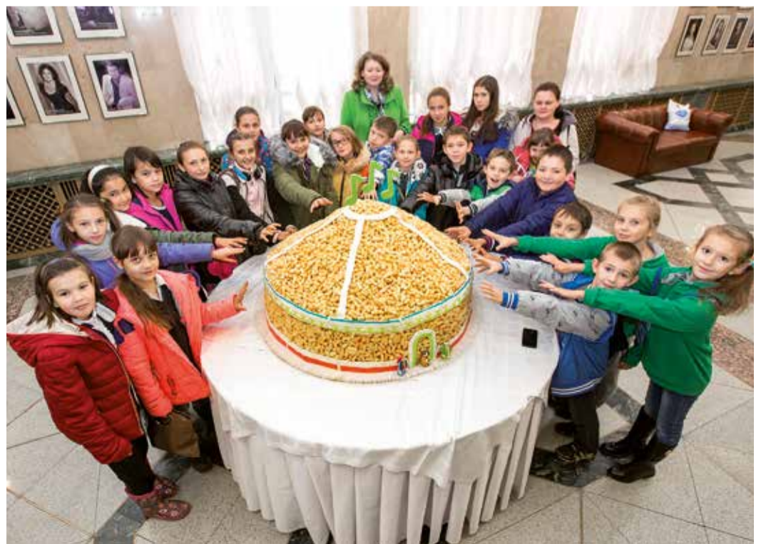
Чак-чак достался каждому зрителю и всем юным артистам концерта