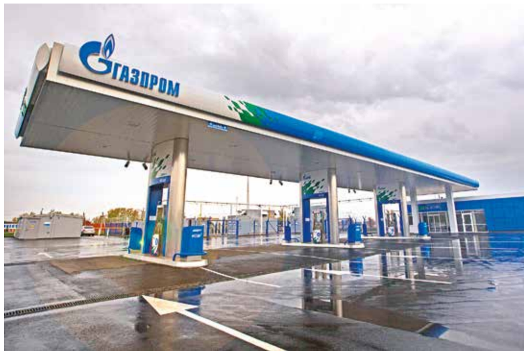
АГНКС-3 (Уфа), в работу!

Напомним, в 2015 году после проведенной реконструкции и технического перевооружения в Уфе введены в эксплуатацию две автомобильные газонаполнительные компрессорные станции – АГНКС-2 (Затон) и АГНКС-1 (Тимашево). На сегодняшний день ООО «Газпром трансгаз Уфа» эксплуатируются 11 автомо-