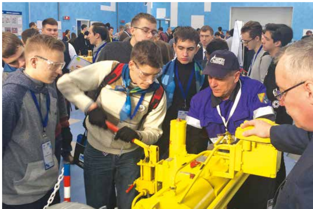
Мастер-класс в Учебно-производственном центре ООО «Газпром трансгаз Нижний Новгород»