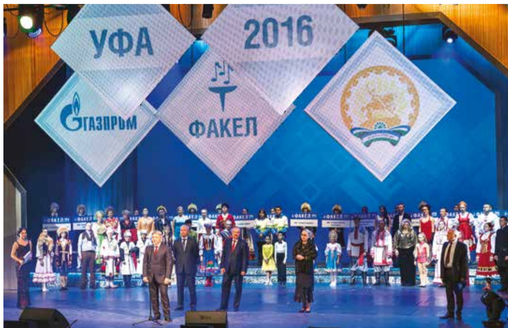
Праздник покорила участников и гостей особенной аурой

Судейство, как всегда бывает на «Факеле», – самое именитое. В его составе – признанные в России авторитеты в области искусства и культуры, такие, как президент Россий-