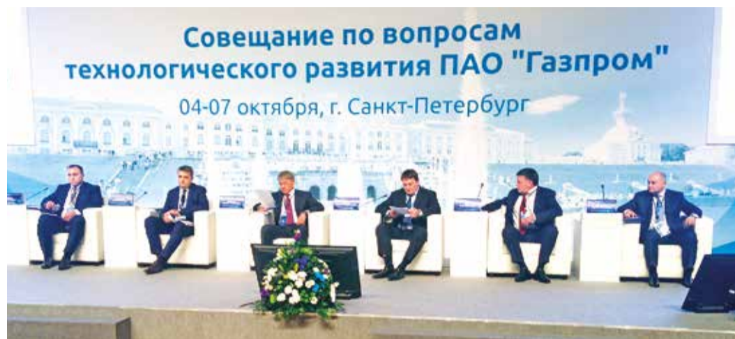
Во время совещания по вопросам технологического развития ПАО «Газпром»

С 4 по 7 октября в конгрессно-выставочном центре «Экспофорум» прошел VI Петербургский международный газовый форум. Данное мероприятие является ведущей российской площадкой для встречи и эффективного общения лидеров газовой индустрии.