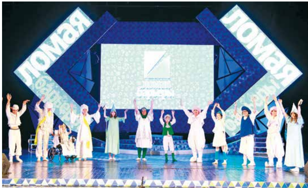
Дружба ломает любые барьеры

Под таким девизом в Уфе 20 октября в рамках фестиваля «Факел» прошел гала-концерт уже четвертого по счету ежегодного фестиваля детского творчества «Ломая барьеры». На его сцене выступили особенные артисты – дети, чьим талантам и вере в себя не мешают никакие диагнозы. В этом году к ним присоединились и юные участники корпоративного фестиваля газозиков «Факел», раздвинув границы проекта до международных масштабов.