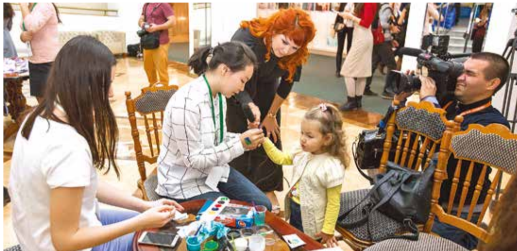
Традиционно перед гала-концертом для детей работали зоны активности