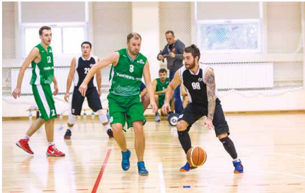
В финале Кубка газотранспортники встретились с командой «Транснефть – Урал»