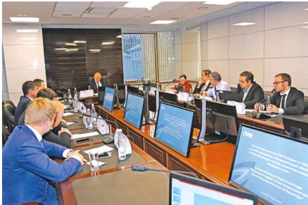
Участники встречи обсудили актуальные вопросы газовой отрасли

С 25 по 28 октября в столице Республики Башкортостан проходила рабочая встреча ПАО «Газпром» и компании Engie. Темой технического диалога стало метрологическое обеспечение измерений расхода и физико-химических показателей природного газа.