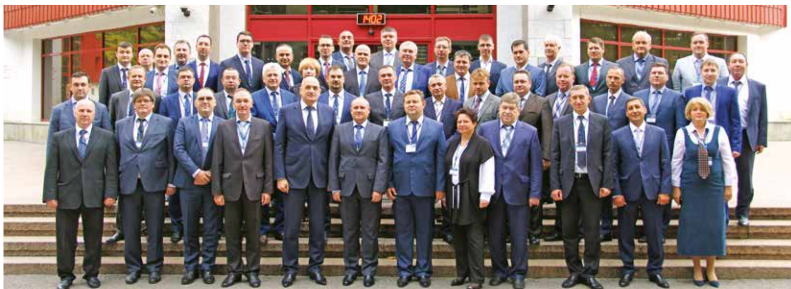
В работе отраслевого совещания приняло участие порядка 100 специалистов в области энергетики

Александр СЕМЕНОВ. Фото Ильфата Мамбетова