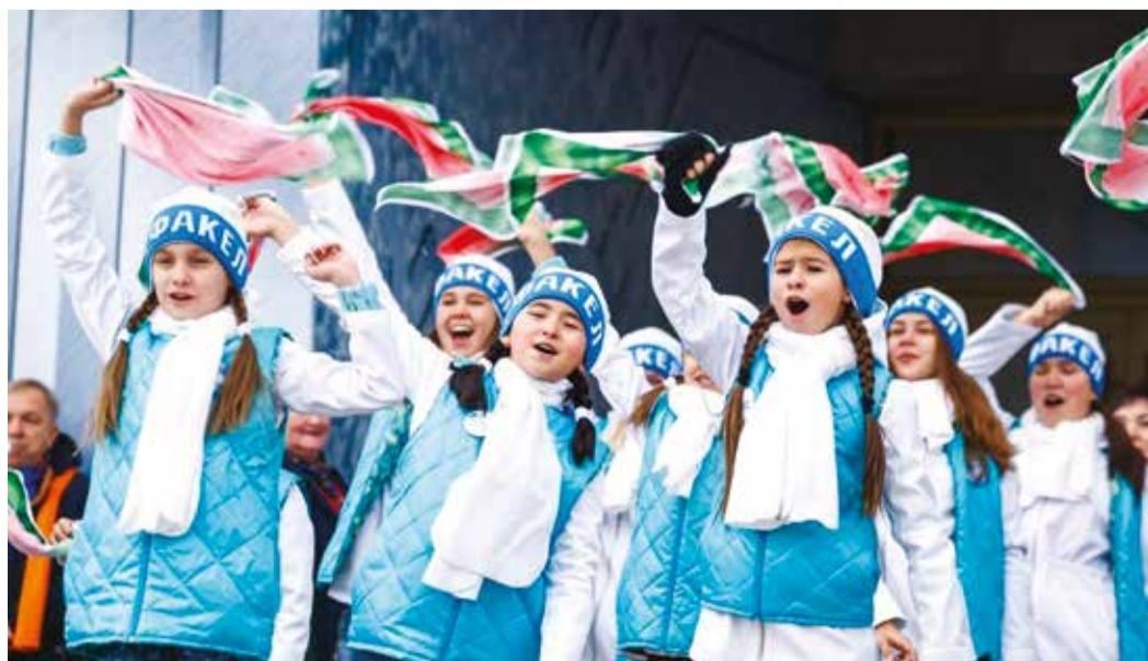
Флешмоб «Здравствуй, фестиваль!»