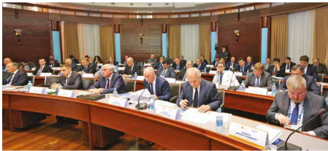
Совещание собрало представителей более 40 предприятий и организаций ПАО «Газпром»

Ольга ЗУБАЧЕВСКАЯ. Фото Ильфата Мамбетова