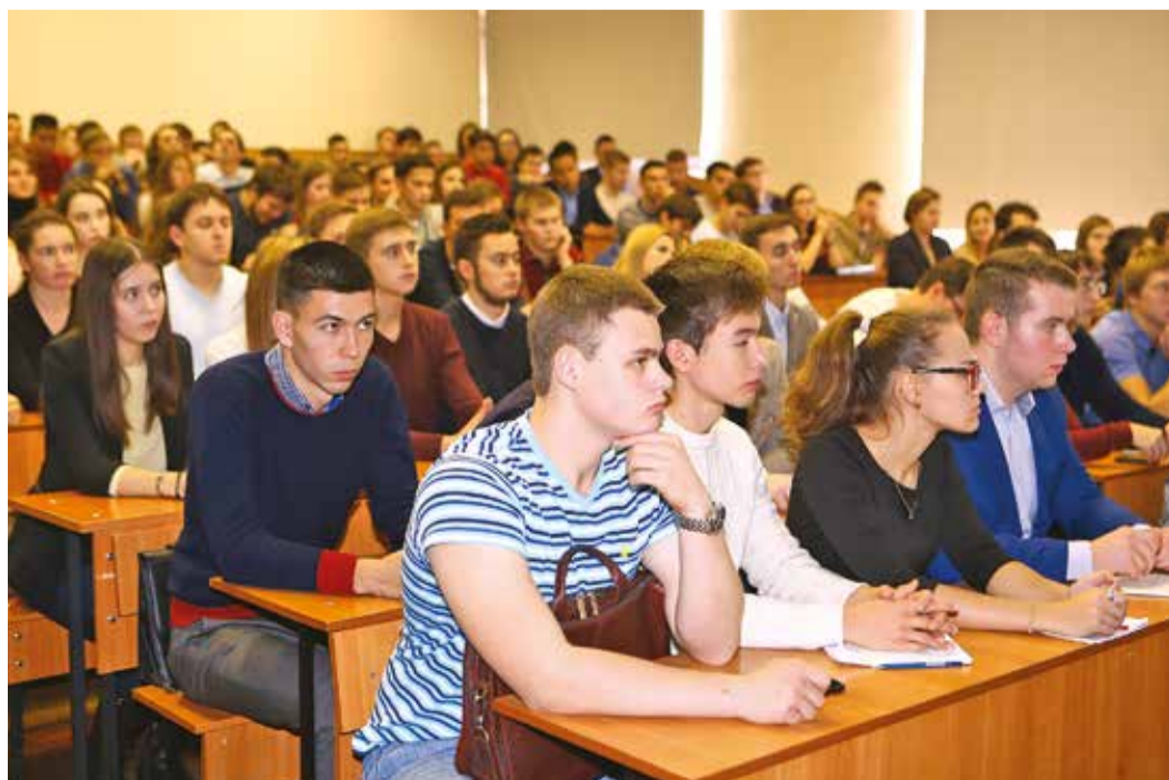
Студенты УГНТУ смогли задать вопросы генеральному директору башкирского газотранспортного предприятия