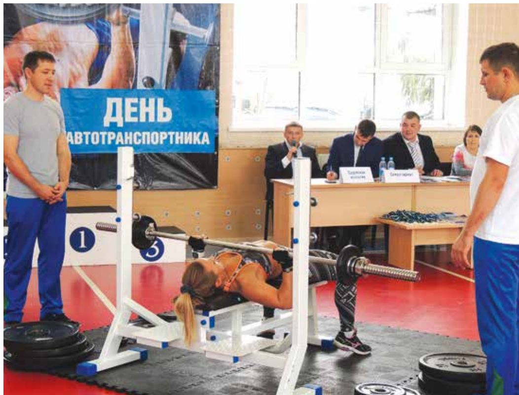
Женщины «Газпром трансгаз Уфа» со штангой на «ты»

Кира ПАВЛОВА, Алексей САЙФУТДИНОВ.