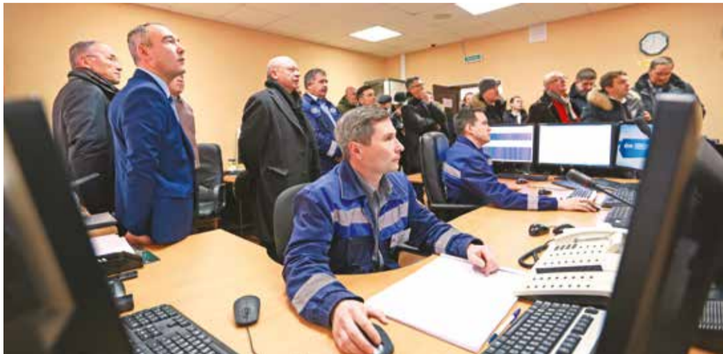
Участники совещания в Дюртюлинском ЛПУМГ знакомятся с техническими новшествами «Газпром трансгаз Уфа»

16 ноября на базе ООО «Газпром трансгаз Уфа» прошло совещание главных инженеров дочерних обществ ПАО «Газпром», в котором приняли участие представители более 40 предприятий и организаций компании из России и Беларуси. Встреча была приурочена к Году охраны труда в ПАО «Газпром». На повестку дня вынесены вопросы соблюдения правил промышленной безопасности на опасных производственных объектах газовой отрасли, взаимоотношений дочерних компаний ПАО «Газпром» с Ростехнадзором, а также создания и поддержания в постоянной готовности аварийно-спасательных формирований.