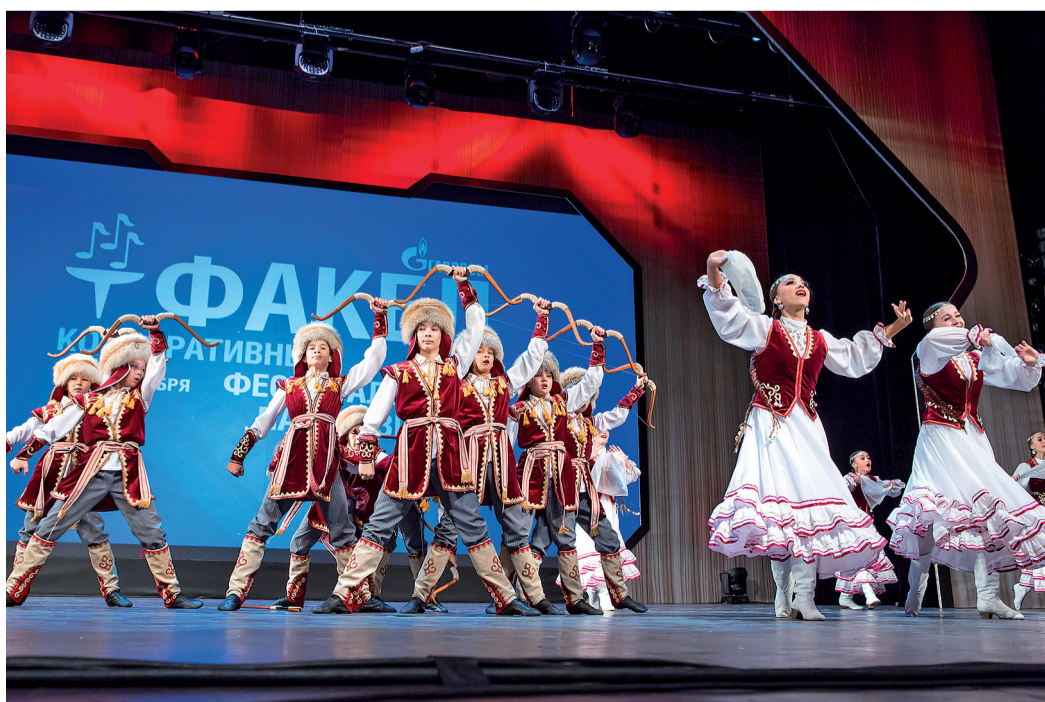
«Далан» (ООО «Газпром трансгаз Уфа»)