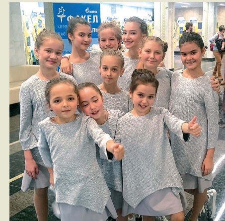
Участники детского вокального ансамбля «Барби коктейль» (ООО «Газпром трансгаз Казань»)

«Мы ходили уже на две экскурсии – по городу и в музей. В музее было очень интересно, нас угостили вкусным медом, но больше всего понравился вид с высоты у памятника Салавату Юлаеву. Очень хочется подольше погулять и посмотреть, что еще есть в Уфе, именно этим мы и займемся в следующие дни!»