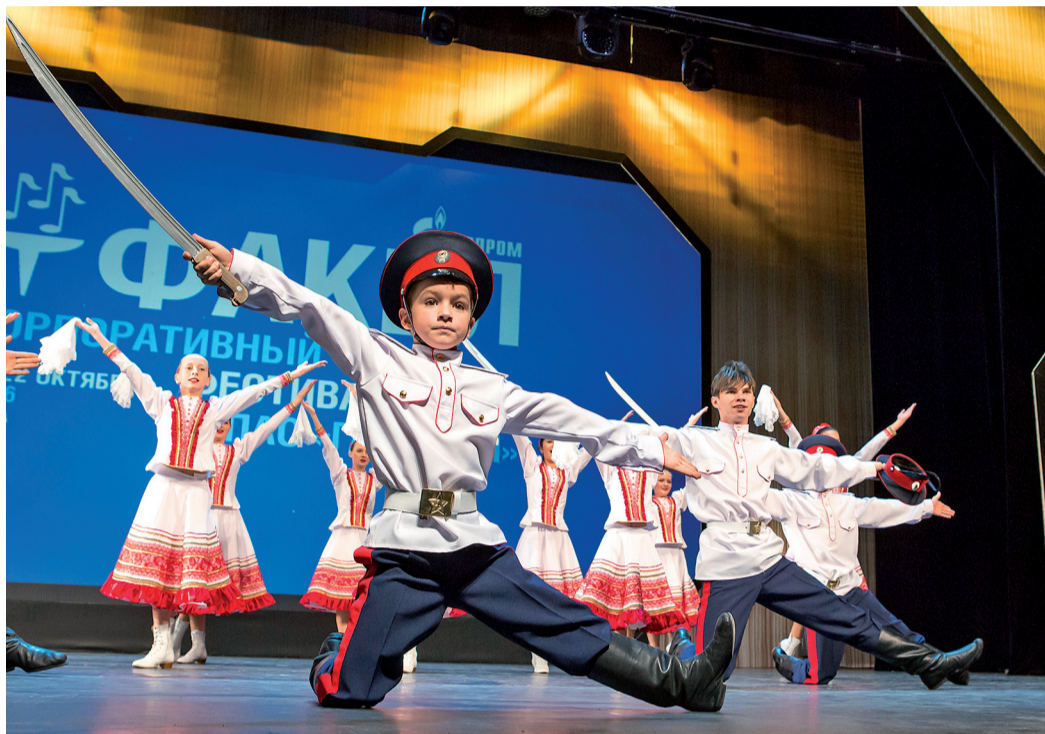
«Донской родничок» (ООО «Газпром трансгаз Волгоград»)