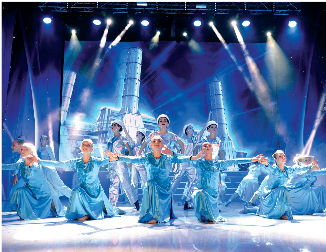
«Незабудка» – сплоченный коллектив

Ежедневные четырехчасовые тренировки и репетиции на сцене, многочисленные выступления на корпоративных и региональных площадках – в таком авральном режиме готовились к «Факелу» участницы хореографического ансамбля «Незабудка» из ООО «Газпром трансгаз Ставрополь».