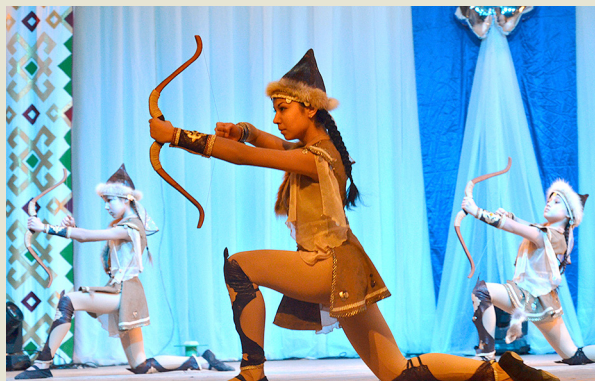
Ансамбль народного танца «Далан» (Кармаскалинское ЛПУМГ)