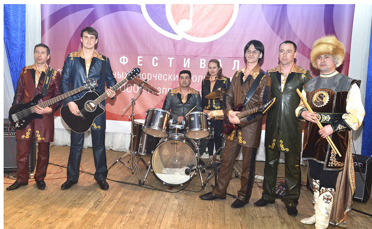
Обладатели Гран-при – ВИА «Юлдаш» (Аркауловское ЛПУМГ)