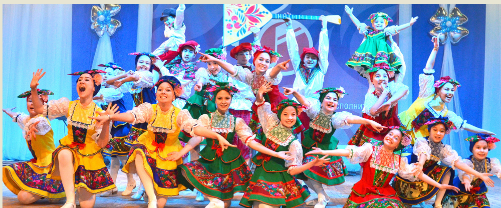
Ансамбль народного танца «Дуслык» (МСЧ)