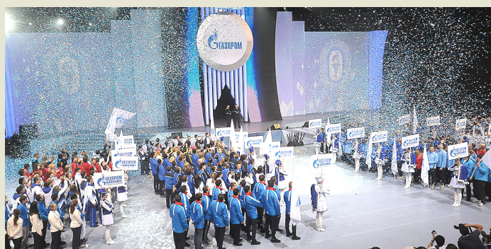
Открытие зимней Спартакиады