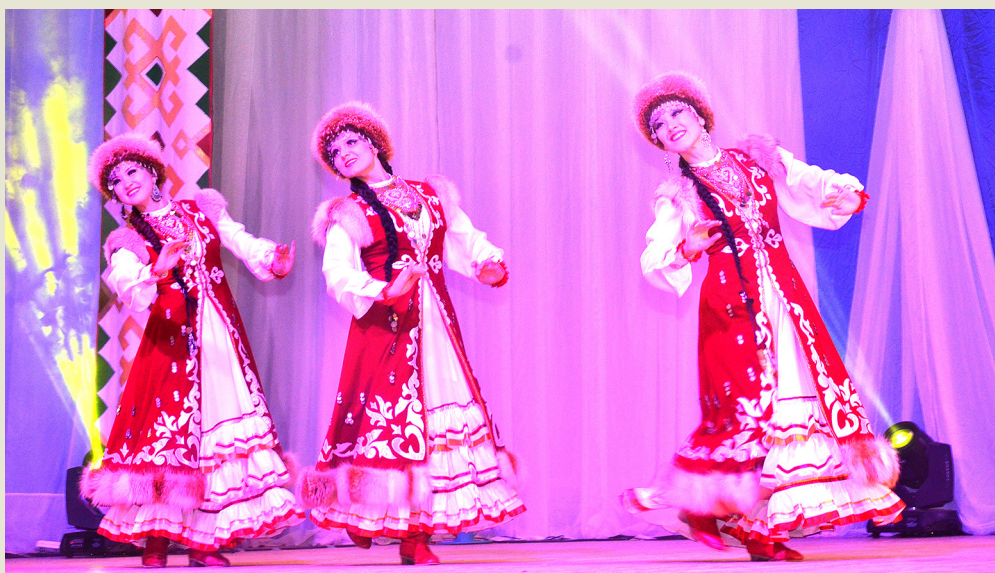
Танец «Бурзяночка» (ИТЦ и МСЧ)