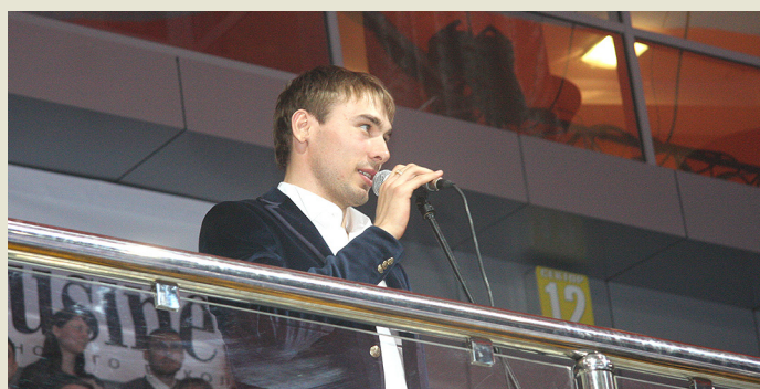
Олимпийский чемпион Антон Шипулин