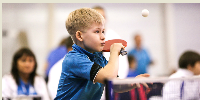
В теннисе главное – точность