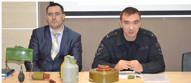
На лекции о действиях при обнаружении взрывных устройств

В начале марта в Инженерно-техническом центре ООО «Газпром трансгаз Уфа» для сотрудников Службы корпоративной защиты была проведена лекция по основам взрывоопасности.