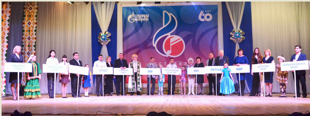
На церемонии открытия