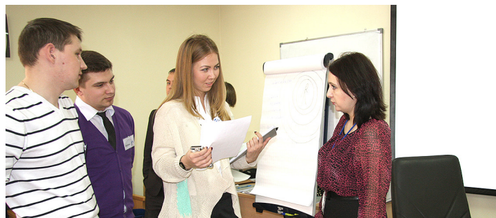
Одна из целей программы – развитие навыков деловой коммуникации

– Производство пропитано коммуникацией, как вертикальной, так и горизонтальной. Работник должен уметь взаимодействовать с коллегами, а также избегать конфликтных ситуаций. Навыки делового общения, компромиссное взаимодействие, понимание того, что хочет руководитель – этому