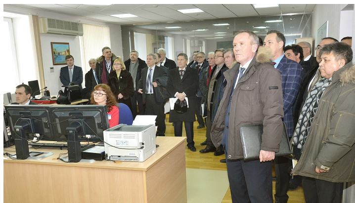
В производственно-диспетчерской службе