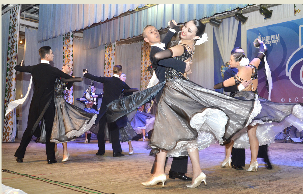
Гала-концерт порадовал зрителей яркими номерами