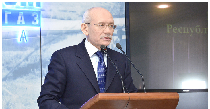
Выступление Президента РБ Рустэма Хамитова

пром трансгаз Уфа» Шамиль Шарипов в своем докладе остановился на перспективах развития газового рынка. По его словам, сегодня необходимо синхронизировать планы развития промышленности со схемами газоснабжения республики, что позволит обеспечить надежную поставку газа как существующим, так и новым потребителям.