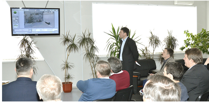
Приемочная комиссия за работой

В ООО «Газпром трансгаз Уфа» успешно прошли приемочные испытания системы обнаружения метана в атмосферном воздухе.