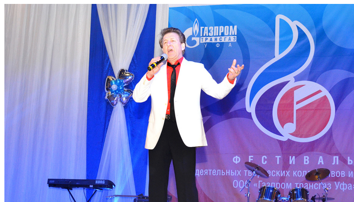
Председатель жюри – заслуженный артист России Геннадий Родионов

Фестиваль, на который съехались около 100 артистов из всех филиалов общества, длился три дня. За это время его участники успели показать почти 60 номеров в самых разных жанрах – народный и эстрадный вокал, хореография, инструментальная музыка, авторская песня; посетить мастер-клас-