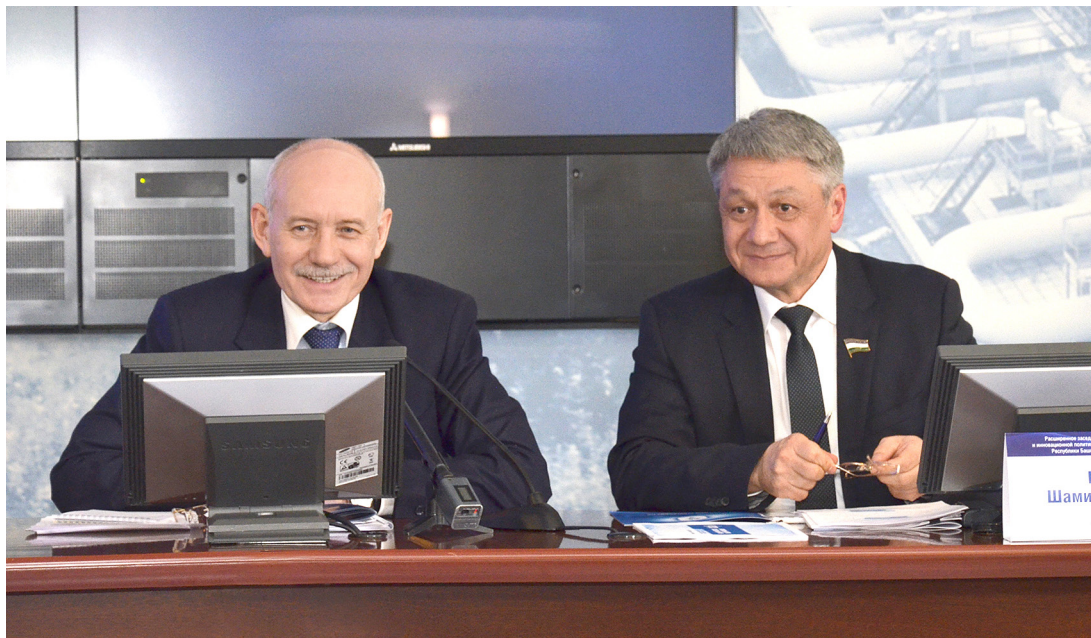
Рустэм Хамитов и Шамиль Шарипов

27 февраля состоялось расширенное заседание коллегии Министерства промышленности и инновационной политики РБ, на котором были рассмотрены итоги работы промышленных предприятий в 2013 году и задачи на 2014 год. В своем выступлении Президент Башкортостана Рустэм Хамитов призвал бизнес к совместному планированию экономического развития республики.