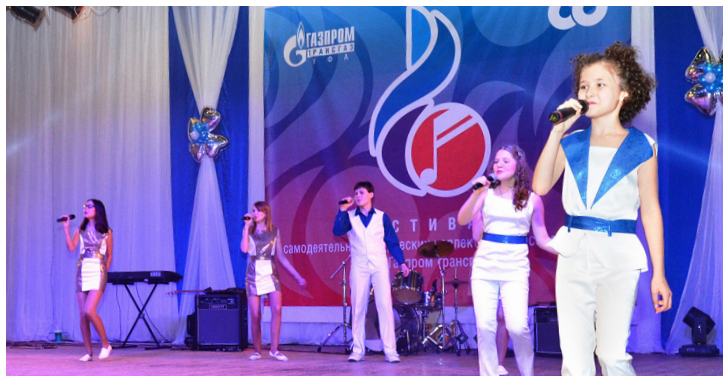
Вокальный ансамбль «Свободный стиль» (Администрация)