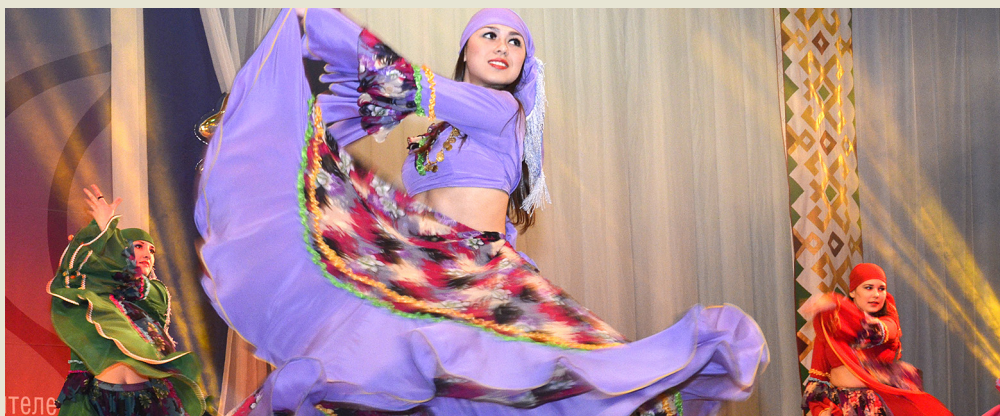
Ансамбль «Ритм» (Приотовское ЛПУМГ)