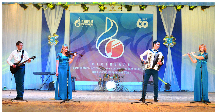
Ансамбль «Микст» (Шаранское ЛПУМГ)